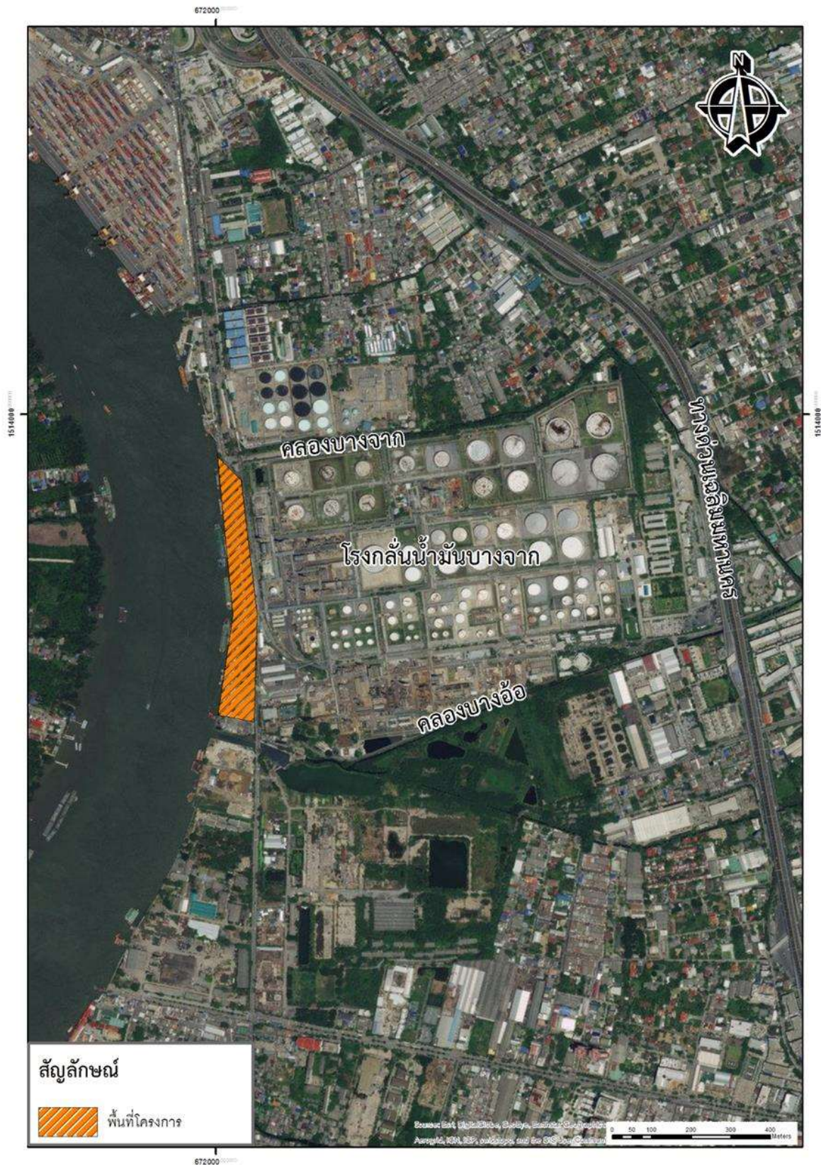
รูปที่ 1-1 ที่ตั้งโครงการท่าเทียบเรือ บริษัท บางจาก คอร์ปอเรชั่น จำกัด (มหาชน)